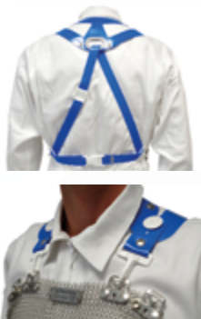
ARNÉS / ARNÉS VITOFIX