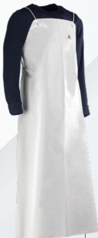
CHAL925B Blanco Branco