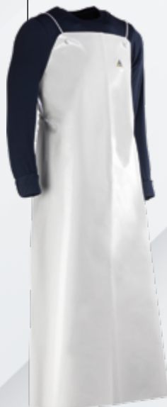
CHFP3935B Blanco Branco