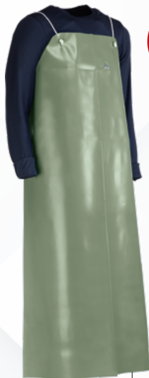
CHEN925V Verde verde