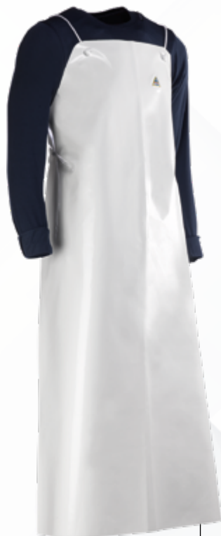
CHEN925B Blanco Branco