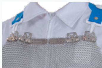
Cuatro puntos de fijación para ajustar Quatro pontos de fixação para ajustar